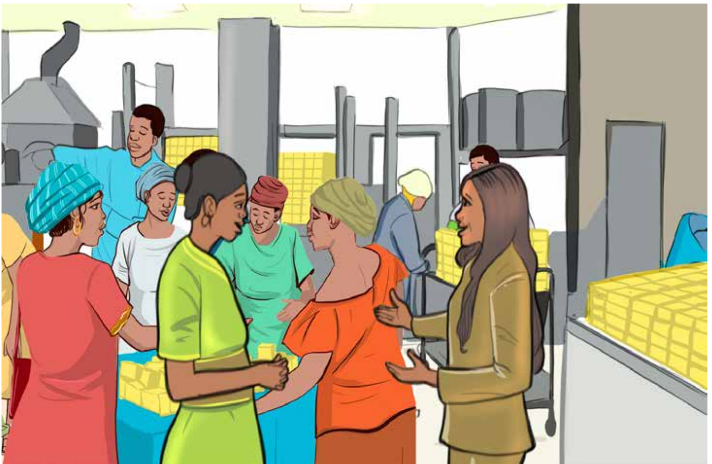
Les bénéficiaires mettent en place des groupes d'épargne et de crédit et créent des activités génératrices de revenus.

Mener des actions qui ont un effet positif dans leurs communautés